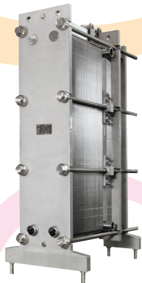
固形物含有液体の短時間 殺菌とロス低減が可能 「FXプレート」