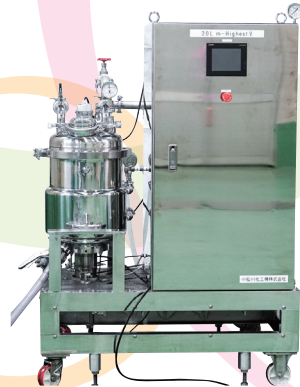
強力なミキシングで 短時間処理が可能 「高せん断ミキサー」