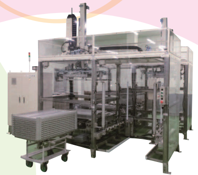
省人化を実現 「レトルト用FAシステム」