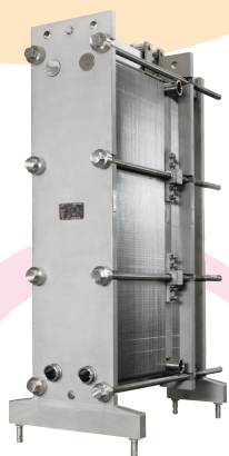
固形物含有液体の短時間 殺菌とロス低減が可能 「FXプレート」