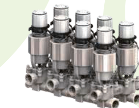
省エネ・省人・自動化を実現 「サニタリー機器・装置」