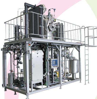
発泡性の強い液でも濃縮可能 「フラッシュ式濃縮装置」