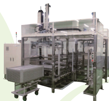
省人化を実現 「レトルト用FAシステム」