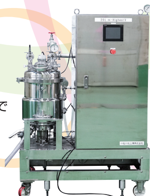
強力なミキシングで 短時間処理が可能 「真空ミキサー」