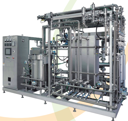
プレート式で省スペース化と 熱回収が可能 「液体連続殺菌装置」