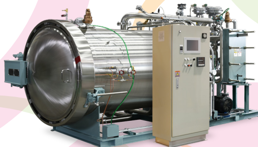
温度にバラツキなく 含気チルド製品の 処理も可能 「調理殺菌機」